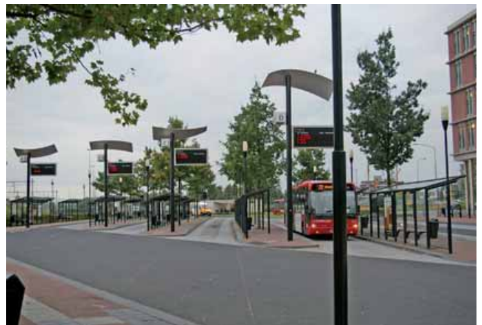
Busstation Almelo in 2008