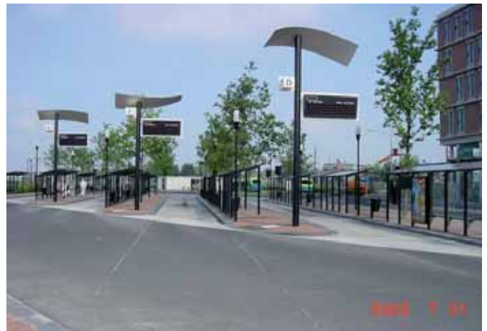
Stedelijk Groen Bomenzand toegepast op busstation Almelo. Situatie in 2003