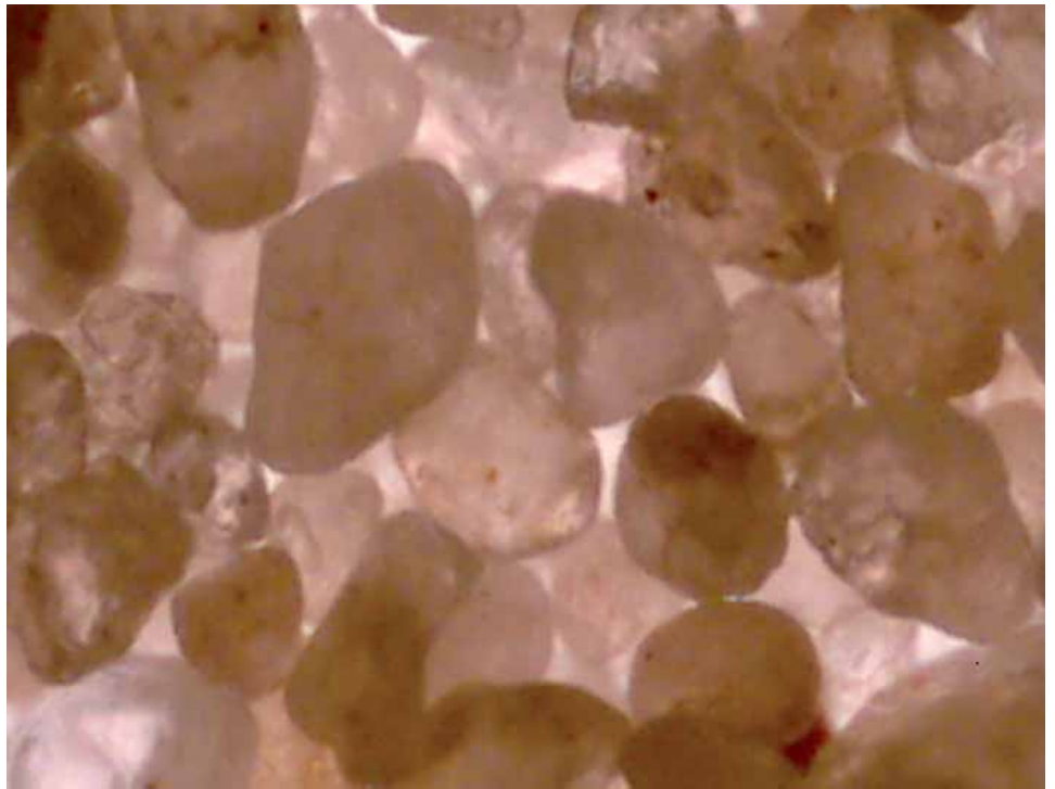
eentoppig bomenzand zwaar vergroot

Soms willen wij bomen planten in een onnatuurlijke omgeving. Onder de bestrating is de mogelijkheid tot doorworteling vaak matig vanwege de grote verdichting bij de aanleg van de straatfundering of die het gevolg is van trillingen veroorzaakt door het verkeer. Stedelijk Groen Bomenzand is een speciaal ontworpen teelgrond voor bomen in of nabij verhardingen zoals wegen, straten en pleinen. Geschikt voor toepassingen onder de bestrating.